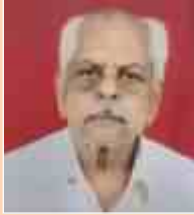
मा.श्री. हुगे सिद्रामआप्पा संचालक